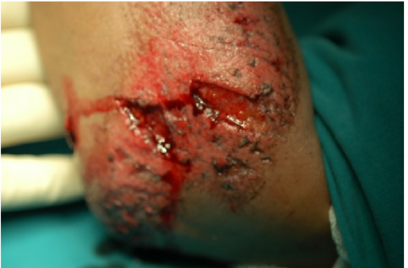
Η ίδια εικόνα και στον αγκώνα