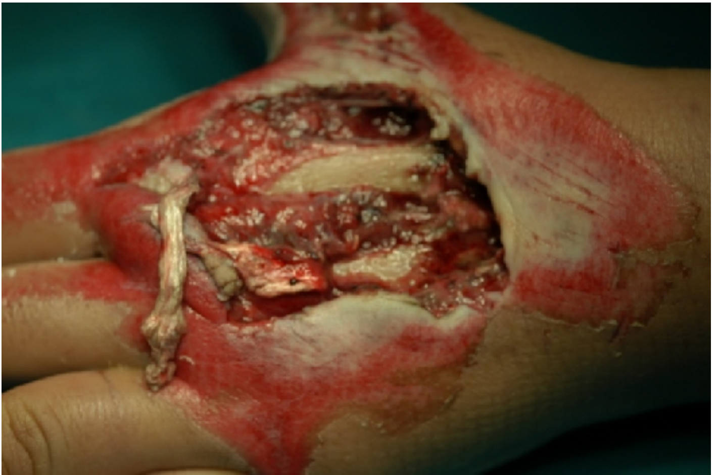
Κλασική εικόνα κάκωσης και εγκαύματος εκ τριβής