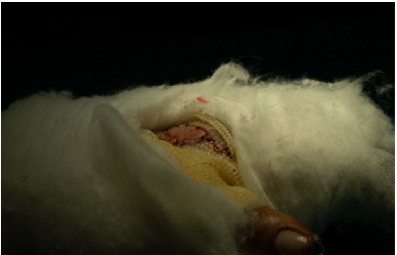
Νησίδα του δέρματος που χρησιμεύει για τον έλεγχο της αιμάτωσης του κρημνού