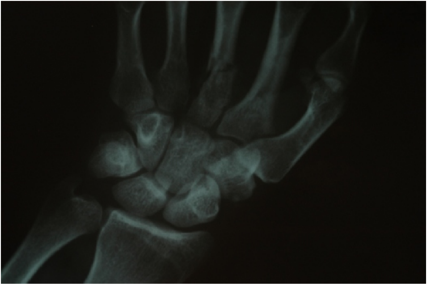
Η ακτινογραφία δείχνει κατάγματα μετακαρπίων