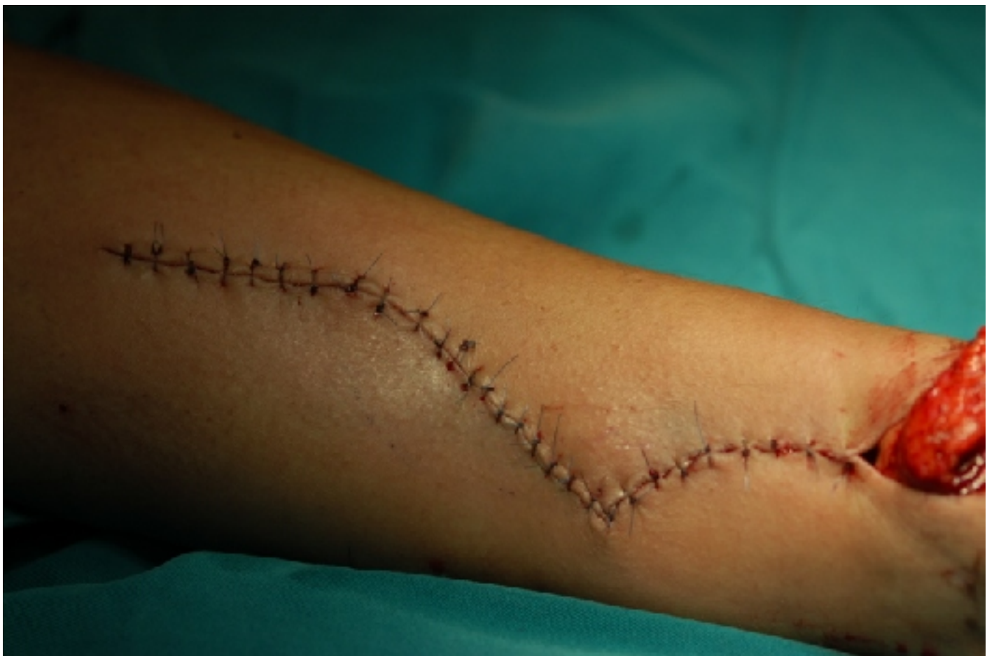
Τομή Z για καλύτερη αισθητική εμφάνιση