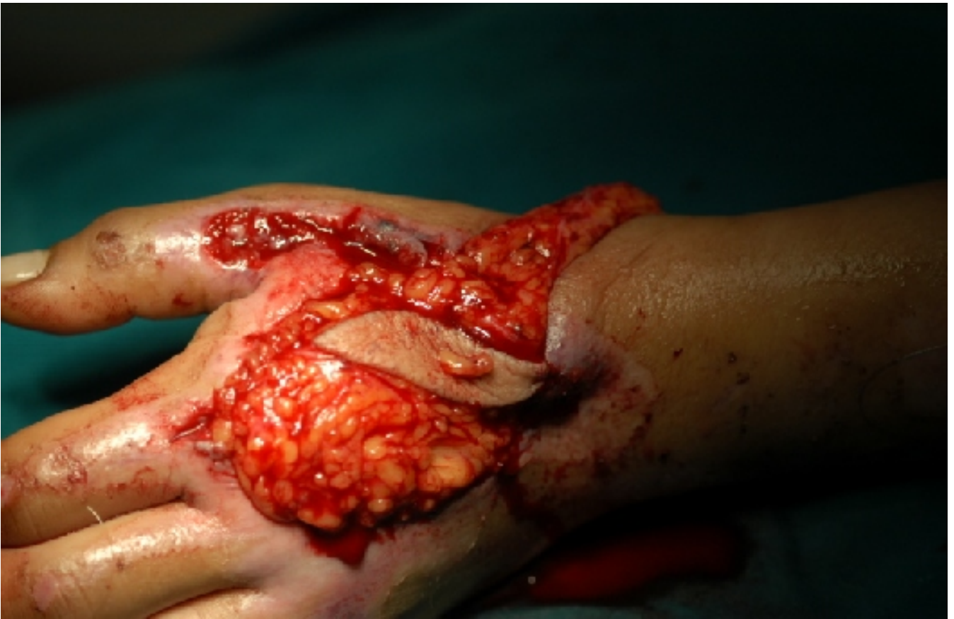
Ο κρημνός καλύπτει το έλλειμμα στη ραχιαία επιφάνεια του χεριού