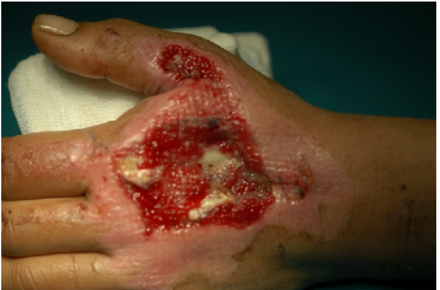
24/5/2003 Μετά από 2 εβδομάδες γίνεται το δεύτερο χειρουργείο